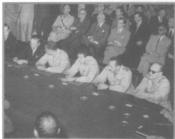
الرئيس عبد الناصر وبجواره المشير عامر وعبد اللطيف البغدادي وصلاح سالم أثناء توقيع اتفاقية الجلاء في ١٩ أكتوبر ١٩٥٤